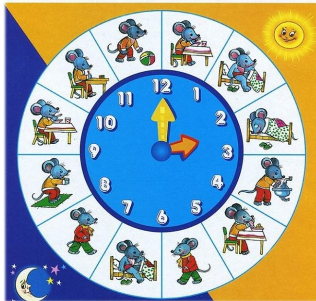
Режим дня в детском саду