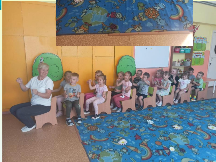
Беседа «Красная книга Урала»