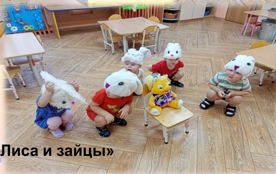
«Лиса и зайцы»