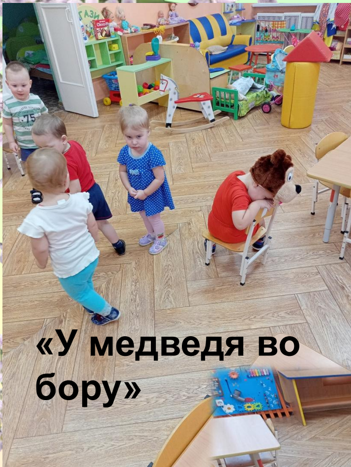
«У медведя во бору»