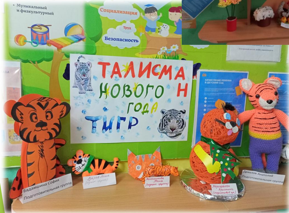
«Талисман нового года»