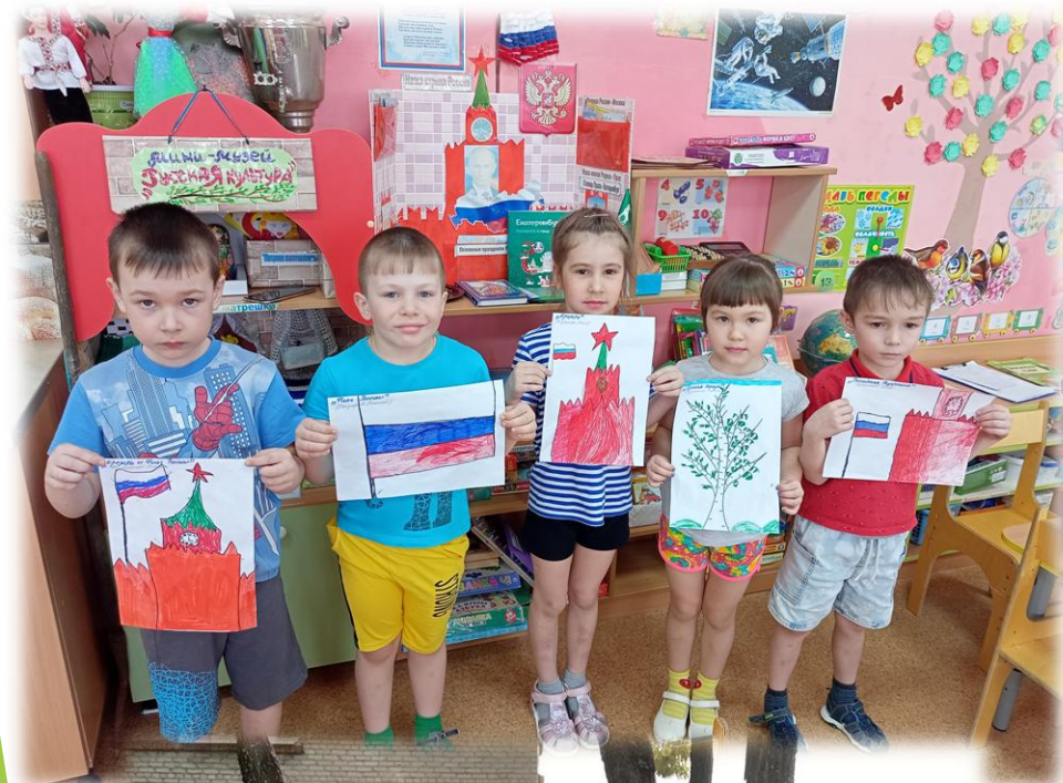
«Мы патриоты России»