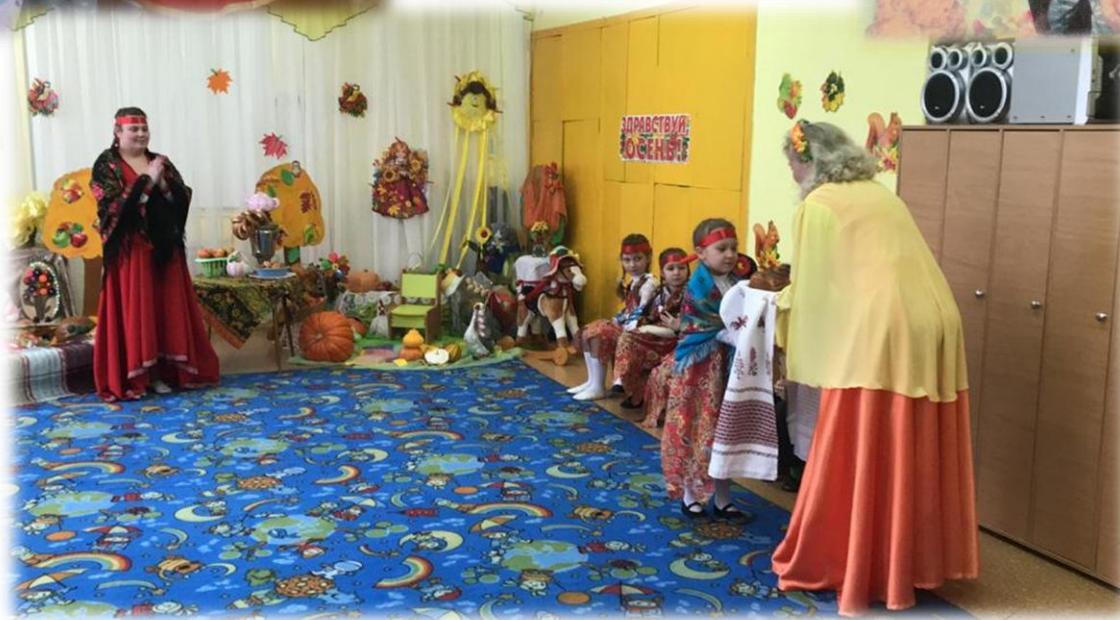
«Осенины на Руси»

Счастлив тот, кто знает настоящее русское чаепитие, но вдвойне счастлив тот, кто бережно хранил его традиции в своей семье.