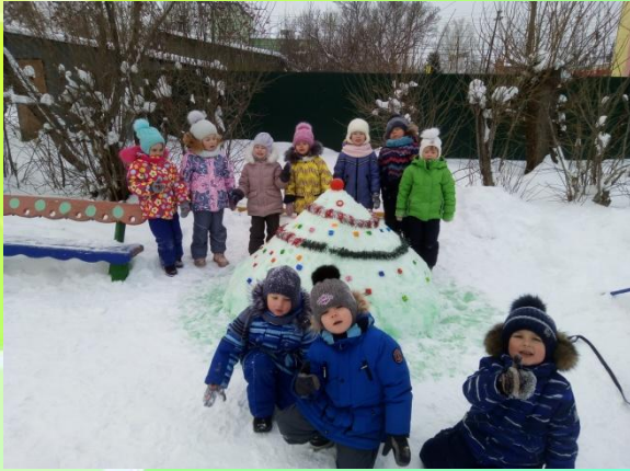
Строили Елочку из снега