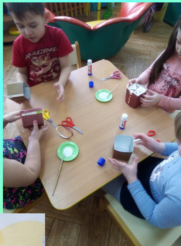
Изготавливали стаканчики для рассады из коробок для сока