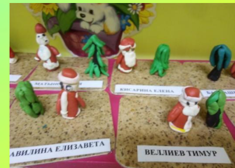
Лепка Дед Мороз