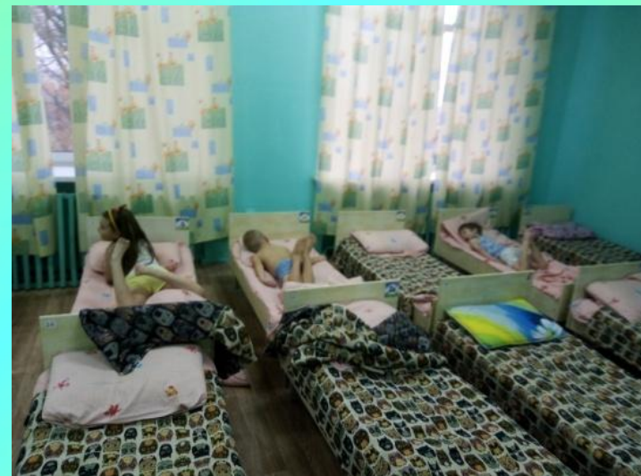
Ходьба после сна по массажным дорожкам, ленивая гимнастика