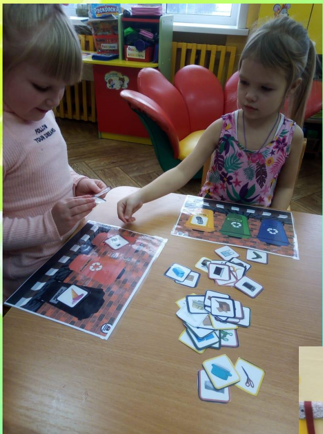
Дидактическая игра «Рассортируй мусор»