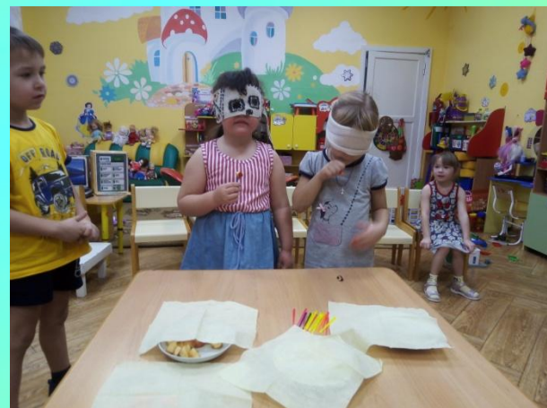
Угадай на вкус