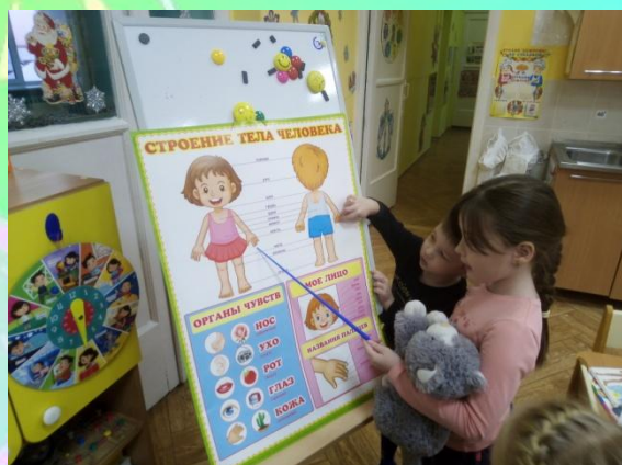
Знакомились со строением тела