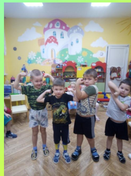
Работа наших мышц