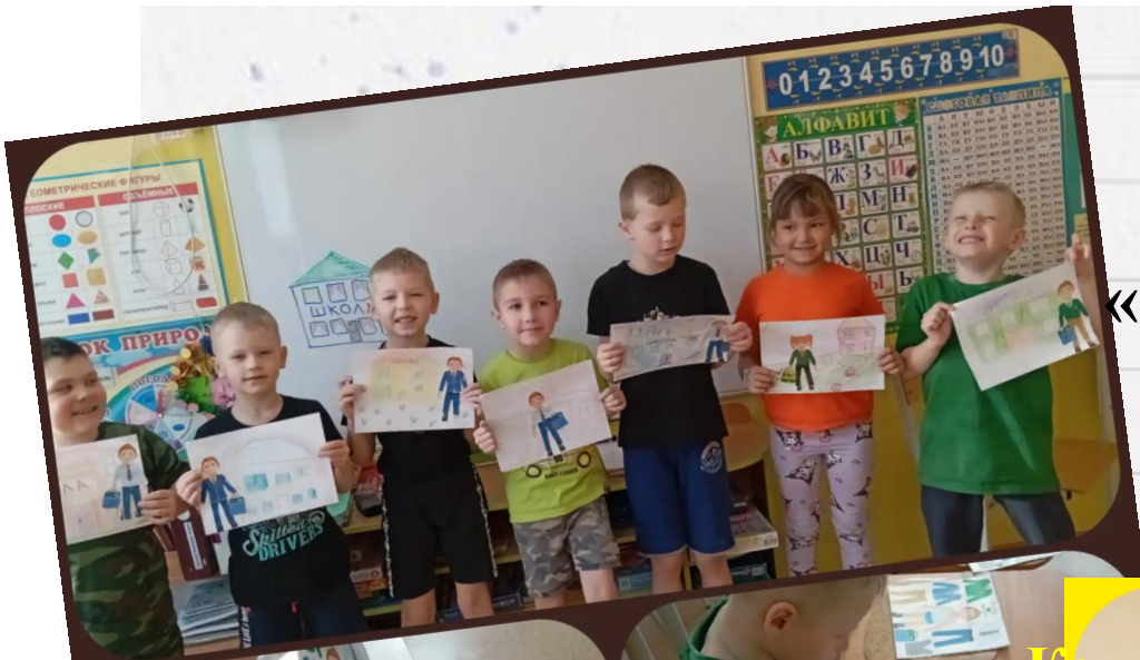
«Рисование «Моя школа»»