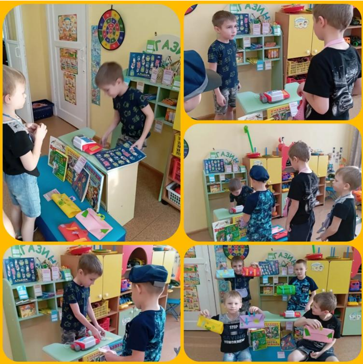
Сюжетно – ролевая игра: «Магазин канцтоваров»