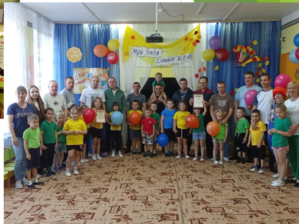
Участие детей и родителей в мероприятиях ДОУ